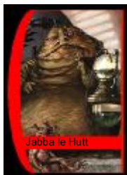
Jabba le Hutt

En dehors de l'Empereur, Dark Vader est l'être le plus craint dans toute la galaxie. Il terrorise même ses propres hommes et ses colères sont violentes et mortelles.