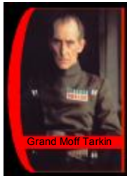
Grand Moff Tarkin

Dark Vader fut autrefois l'élève d'Obi-Wan Kenobi. Jeune chevalier Jedi prometteur, il fut séduit par la voie " facile " du Côté Obscur de la Force. Il défia son maître et fut laissé pour mort après avoir échoué. Bien que gravement défiguré, il survécut. Il porte un casque qui non seulement lui permet de respirer mais inspire la crainte à tous ceux qui le voient. On dit que ses pouvoirs du Côté Obscur sont devenus immenses et qu'il est le bras droit de l'Empereur.