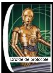
Droïde de protocole

Nous sommes les premiers à penser que les droïdes de protocole peuvent être parfois très irritants mais leurs possibilités sont immenses. S'ils sont bien programmés, ils peuvent parler et traduire instantanément jusqu'à 7 millions de langues. Ils peuvent être équipés de divers modules mais sont généralement inutiles pour d'autres tâches que le protocole et les communications. Plus encore que les astromécanos, les droïdes de protocole peuvent développer une personnalité si leur mémoire n'est pas effacée pendant de longues périodes.