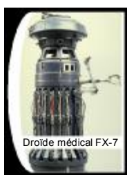
Droïde médical FX-7

De nombreux patients sont reconnaissants pour le traitement rapide et efficace qui leur a été administré par un droïde médical. Il en existe de nombreux types, du simple droïde de diagnostic MD-0 aux modèles MD-4, utilisés pour la microchirurgie. La plupart des droïdes médicaux ont leur propre spécialité mais le MD-5 est un droïde généraliste qui peut remplacer des spécialistes en cas de besoin. Un autre type de robot très populaire est le 2-1B de GeenTech, un modèle très versatile, un peu plus ancien que les séries MD mais encore très répandu dans toute la galaxie.